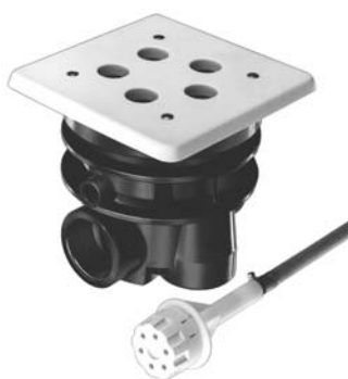
Ausführung III 5 Düsen à Ø 19 mm Design III 5 dia. 19 mm nozzles (Nur als Wanddüse vorsehen! Use as wall nozzle only!)