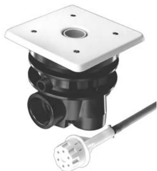
Ausführung I Düse Ø 40 mm Design I with dia. 40 mm nozzle bzw. / or Ausführung II Düse Ø 28 mm Design II with dia. 28 mm nozzle