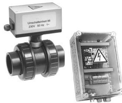
Umschalteneinheit '96 Change-Over Unit '96

Bei dieser Kombination können Sie wahlweise gegen den kräftigen Strom der BADU Jet-Anlage anschwimmen oder sich angenehm entspannend mit oder ohne Luftperlbad über die BADU Wand- und Bodendüsen massieren lassen. Der Pneumatiktafter zum Umschalten ist im BADU Jet-Gehäuse eingebaut (Umschaltdauer ca. 1 Minute).