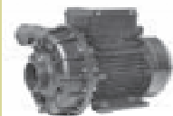
Pump mit max. Förderstrom 50m 3 /h oder 70m 3 /h