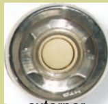
externer Air Ex Schalter