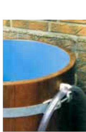
RT K Detail