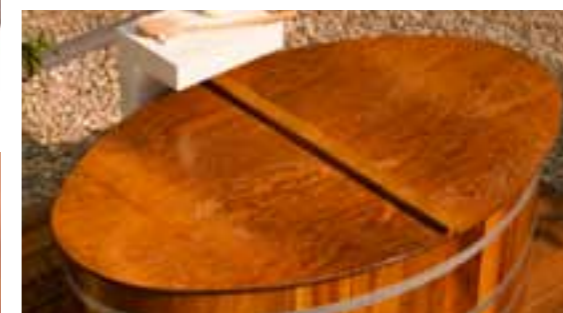
Deckel Thermosperrholz / Lasur