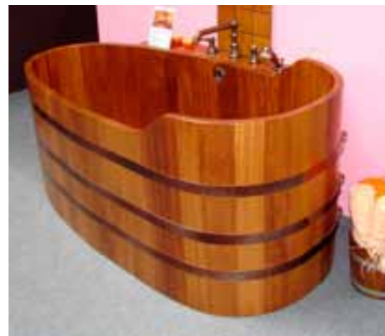
BW K 135x73x60/70 UL PVC, WA längs, antik