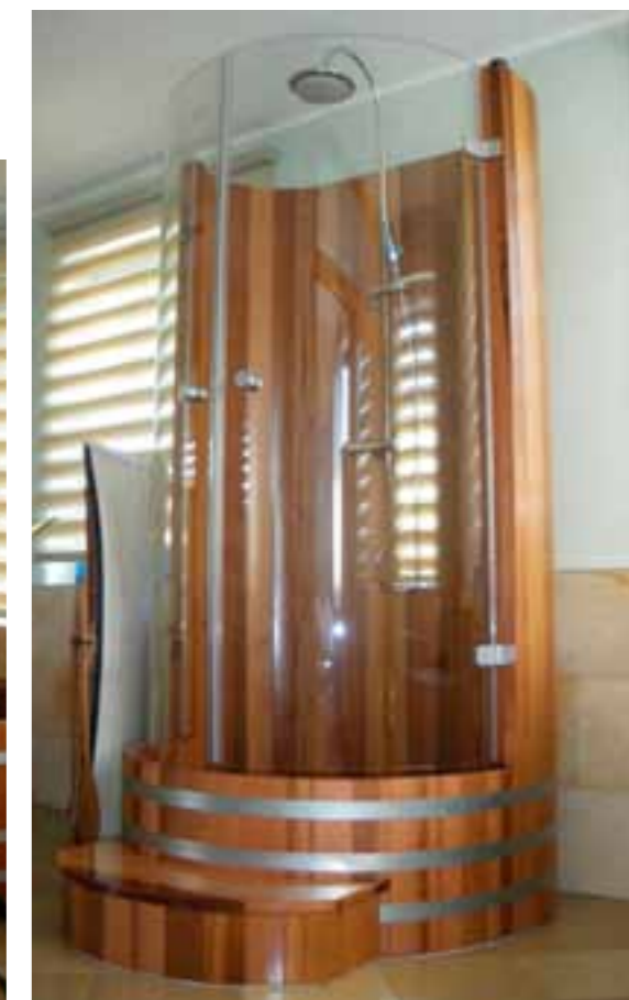
DK RC, V2A, ST DK, ME DK