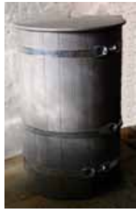
RTL 63 „silbergrau“