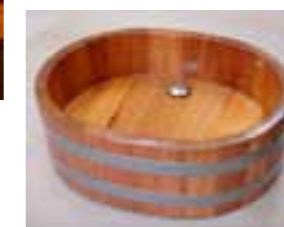
WB K 65x52, Clicker