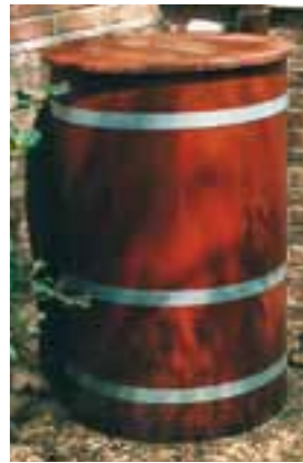
RT K 63