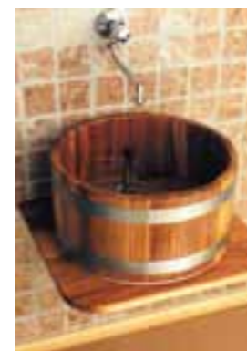
WB K 51, WTP, V2A

Als auf dem Fußboden stehende Säule oder als Aufsatzbecken zur Montage auf einem separaten Tisch o.ä., aus Lärche oder Kambala, innen und außen mit transparenter Hygieneversiegelung beschichtet, mit 2 nachspannbaren feuerverzinkten Bandstahlreifen, inklusive 1¼“-Ablaufventil mit verchromtem Messing-Standrohr 120 mm als Überlaufsicherung, alternativ ohne Aufpreis mit Clickerventil / ohne Überlaufsicherung. Beckentiefe ca. 15 cm. Montageskizze senden wir auf Anfrage gern zu.