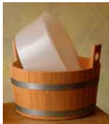
410/01 + ES FW

(*) Wir empfehlen bei naturbelassenen Fußwannen, diese vor Verwendung zu lackieren oder anderweitig vor Holzfeuchteschwankungen zu schützen (z.B. Einsatz), um zu verhindern, dass diese undicht werden.