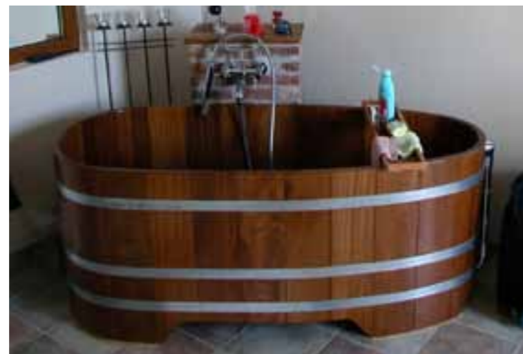
BW K 167x73x70 Kt, UL Chr