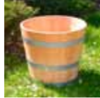
PK Ei Ø45