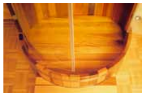
DK RC, ST