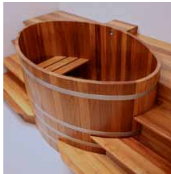
TB K 168x106x100 + 5 x IS120K + UL + „Specials“