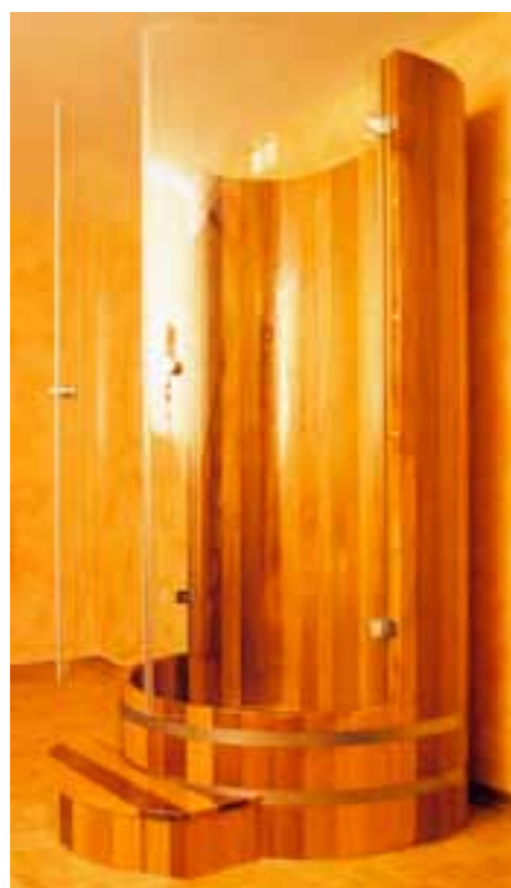
DK RC, V2A DK, ST DK