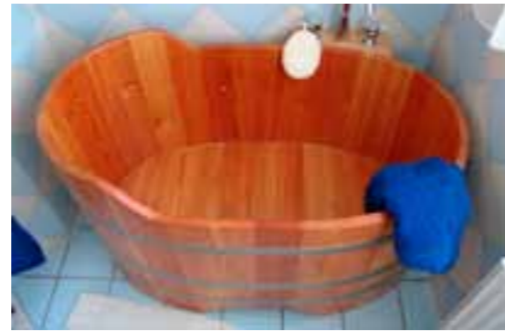
BW L 122x72x65/75 Kt, WA längs

(*) ... Bitte fügen Sie bei der Best.Nr. ein „K“ für Holzart Kambala oder ein „L“ für Lärche ein.