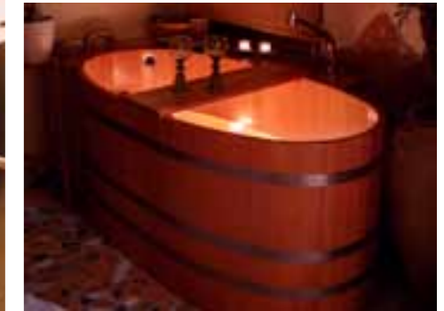
WWL ... + UWS