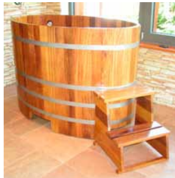
TB K 149x90x100 + K556 + UL MS