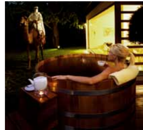
TB K Ø153, V2A XXL, Outdoor