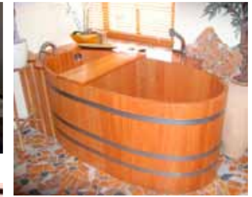
WWL 161x79x70, LB, V2A, TAB