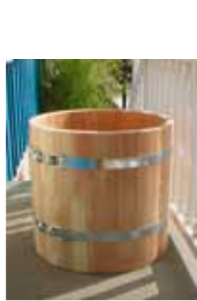
PB L Ø63x70 natur