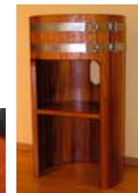
WT K, EB