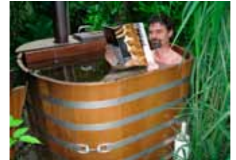
BB K 130x126