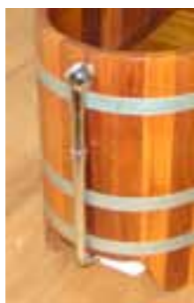
UL Chr BW