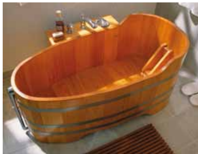
BW L 151x73x60/70 Kt, UL Chr, RL, WA längs, V2A