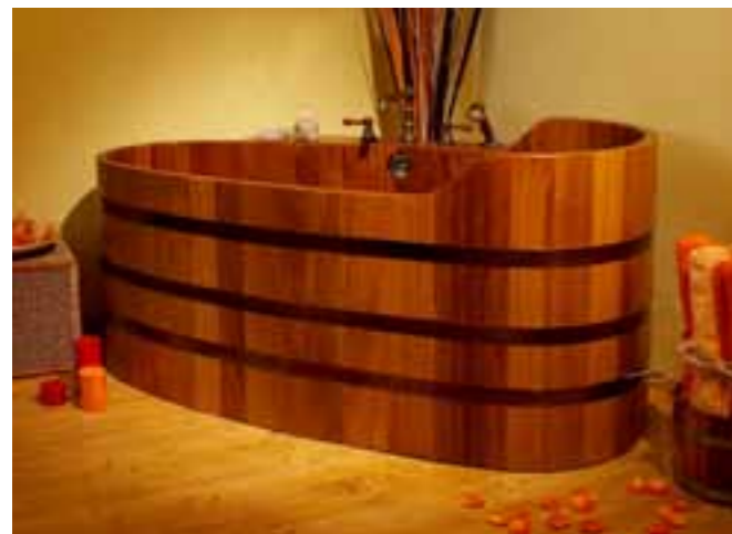
BW K 151x73x70/80 UL PVC, WA Eck, antik