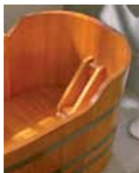
RL + OWR