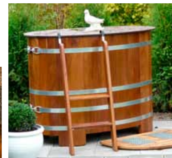
TB K 130x79 + Deckel Sperrholz / Lasur

Bandstahlreifen aus Edelstahl anstatt feuerverzinkter Reifen (siehe Tabelle unten, Preise für kompletten Satz)