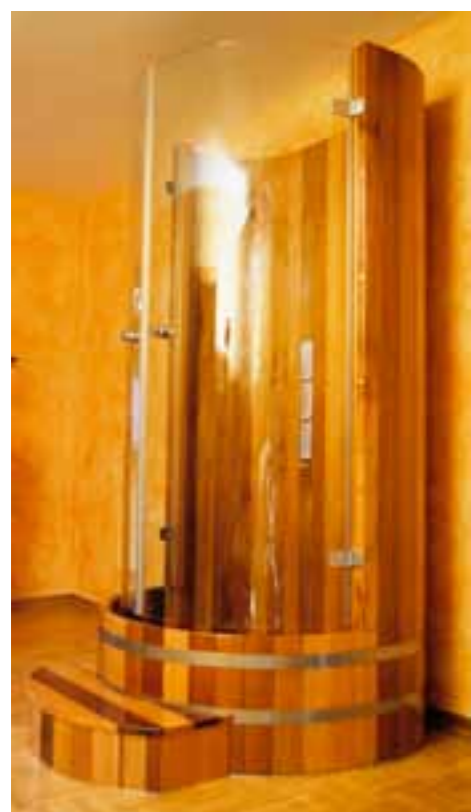
DK RC, V2A DK, ST DK