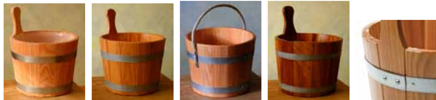
401/01 + ES 5L

(* Wir empfehlen bei naturbelassenen Kübeln, diese vor Verwendung zu lackieren oder anderweitig vor Holzfeuchteschwankungen zu schützen (z.B. Einsatz), um zu verhindern, dass diese undicht werden.