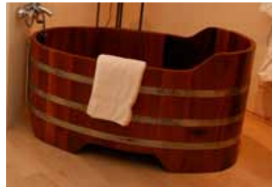
BW K 130x79x60/70 Kt