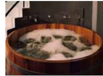
WP K Ø133