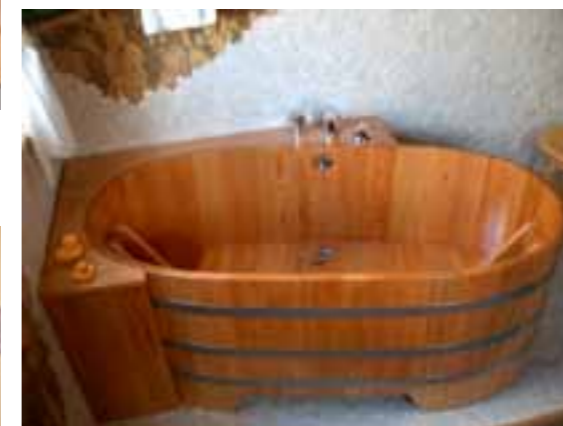
WA Eck diag.