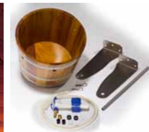
Einzelteile / Lieferumfang 522/05 (separat parts 522/05)