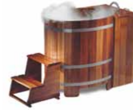
WP K 100x72, V2A, LB