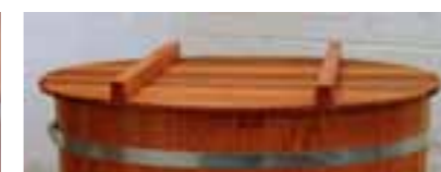
Deckel Red Cedar / Lasur