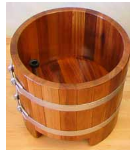
FW K 50/07