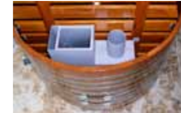
Unterwasserofen / snorkel stove