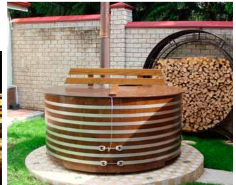
BB ACC Ø207