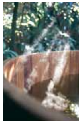
Detail TB K 153