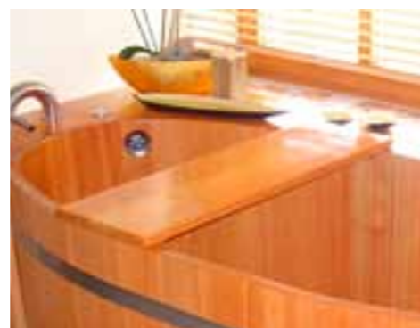
TAB L 80