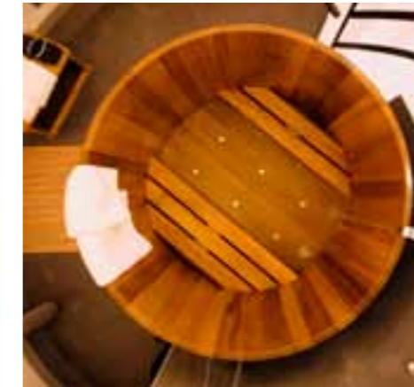
WP K Ø133