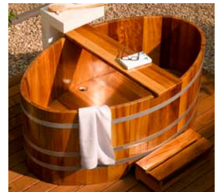
BW K 168x106x70 V2A, TAB, TS