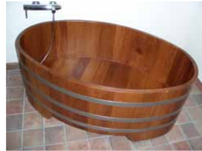
BW K 149x90x60 Kt