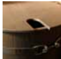
Deckel / cover