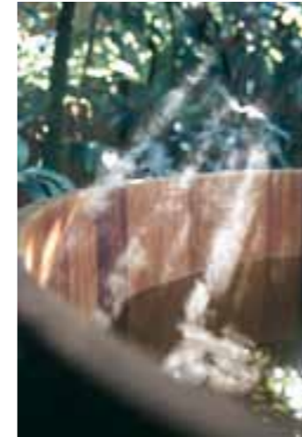
BB K Ø153

Ebenso raten wir eindringlich von selbst zu montierenden Bottich-Bausätzen ab.