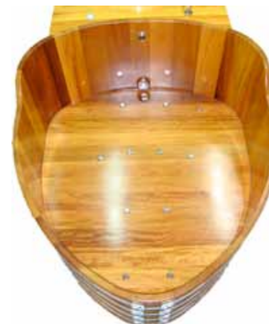
WW K 164x140x70/80 „LoveBoat“, UL PVC, WA Kopf, UWS, WP-Technik