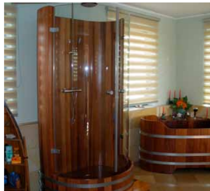
DK RC, V2A, ST DK, ME DK (+ BW K)