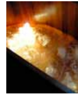
WWK + UWS