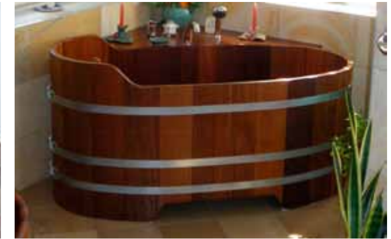
BW K 161x79x70/80 Kt, WA Eck diag.